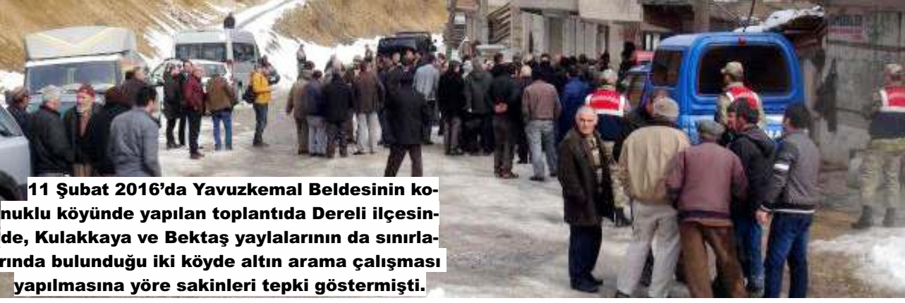
11 Şubat 2016'da Yavuzkema Beldesinin köyünde yapılan toplantıda Dereli ilçesinde, Kulakkaya ve Bektaş yaylalarının da sınırlarında bulunduğu iki köyde altın arama çalışması yapılmasına yöre sakinleri tepki göstermişti.

TBMM Başkanlık Divanı Üyesi ve Giresun Milletvekili Necati Tıgılı, "Giresun ilinde madencilere tahsis edilen toplam alan 256 bin 106 hektardır. Giresun'da 47'si arama, 82'si işletme olmak üzere toplam 129 ruhsat dağıtıldığı görülmektedir" dedi. Dereli'de 10'u işletme 8'i de arama ruhsat olmak üzere 18 şirketin maden için başvurusu bulunuyor.