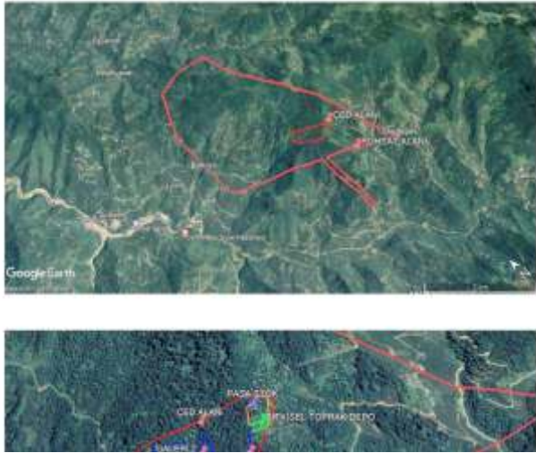
PROJE ALANI UYDU GÖRÜNTÜLERİ VE FOTOĞRAFLARI

Milletvekili Tıgılı'nın "Maden ocağından ne kadar tarım alanı ne kadar makilik ve meşelik alan, ne kadar ormanlık alanı zarar görecektir araştırınız mı, ortaya çıkan sonuç nedir" sorusuna da Bakan Kurum, "Proje kapsamında kullanılması planlanan tarım arazileri konusunda Tarım ve Orman Bakanlığınca bilgi alınmasının uygun olacağı değerlendirilmektedir" şeklinde yanıt verdi.