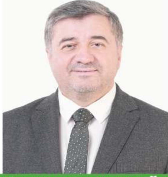
AYTEKİN ŞENLİKOĞLU GİRESUN BELEDİYE BAŞKANI