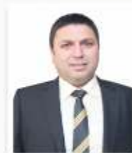
ŞİNASI KABACAOĞLU BAĞIMSIZ